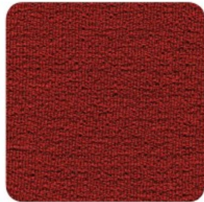
DARK CRIMSON 010